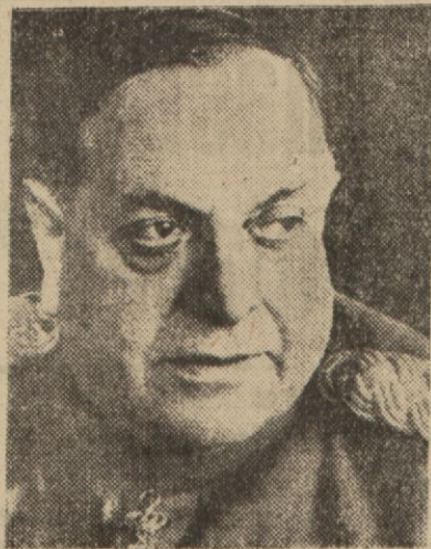
Yugoslav Genel Kurmay Başkanı General Nedich